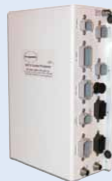
Controlprocessor Model EEC3

Dubbele accu-ingangen — een van de belangrijkste eisen die aan elektronische motorcontrolesystemen wordt gesteld, is accuvermogen. De EEC3-processor van Glendinning kan met twee verschillende accu's worden gevoed. Dit waarborgt dat het controlesysteem nooit kan uitvallen.