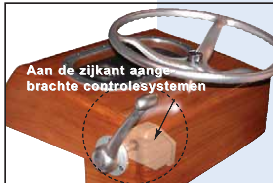
Aan de zijkant aangebrachte controlesystemen

Glendinning ontwerpt en vervaardigt kwaliteitsproducten voor de zeevaart. In ruim 30 jaar hebben we onze reputatie gevestigd als een bedrijf dat hoogwaardige, betrouwbare producten van blijvende waarde levert. Ontdek waarom we zeggen: "Ontspan u ... we varen met u mee!"