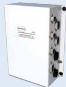
Back-upprocessor voor transmissie- gasklep