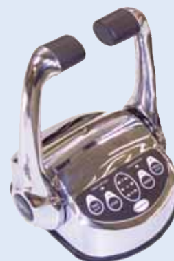
Hoofdstation Model CH2001